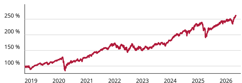
— JPMorgan ETFs - Global Research Enhanced Index Equity