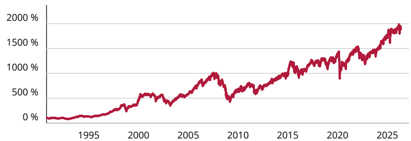
— Fidelity Funds – European Growth Fund A