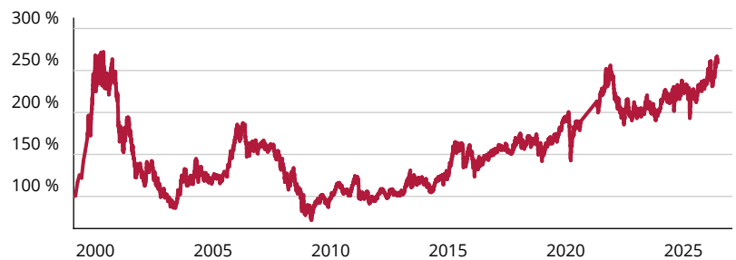
— Fidelity Funds – Sustainable Japan Equity Fund A