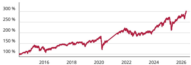
— Fidelity Funds – Fidelity Target 2050 Fund