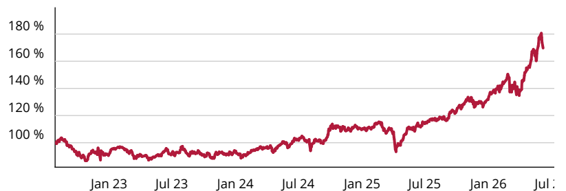
— UBS ETF (LU) MSCI Emerging Markets Socially Responsible UCITS ETF (USD) A-acc