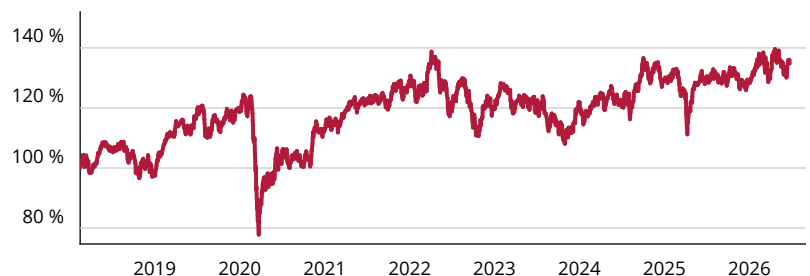
— Amundi Index MSCI Pacific ex Japan SRI PAB ETF