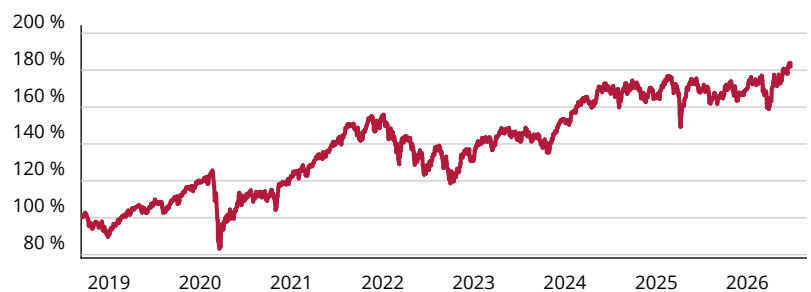
— Amundi MSCI Europe SRI Climate Paris Aligned ETF