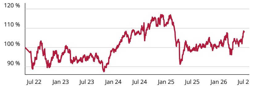
— CT (Lux) SDG Engagement Global Equity R