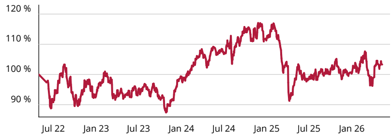
— CT (Lux) SDG Engagement Global Equity R