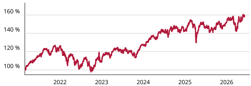
— UBS (LI) FS - MSCI Europe Socially Responsible UCITS ETF (EUR) A-acc